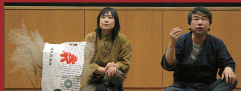
鹿踊りのはじまり